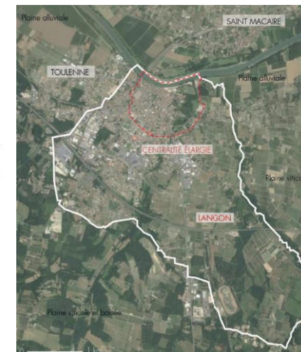
□ Périmètre communal_1371ha □ Périmètre de réflexion (centralité)_env.88ha