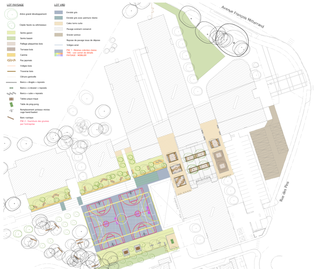
Plan masse de l'aménagement de la cour – QLAADF & ALTO STEP