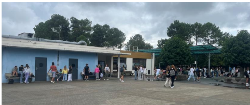
Cour - état existant