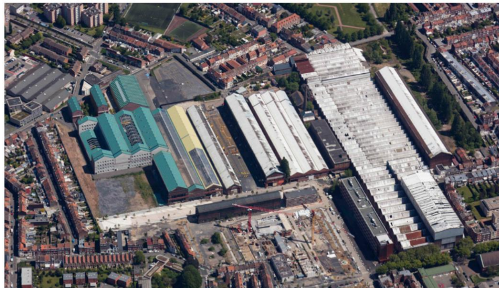
Photo aérienne du site Fives Cail

La présente mission appelle à poursuivre la réflexion sur le développement d'un quartier équilibré, économiquement efficace, socialement équitable et écologiquement soutenable sur un ancien site industriel . La présente mission d'AMO Développement Durable, a pour but d'accompagner SORELI dans la poursuite du projet urbain et l'accompagnement de sa mise en œuvre . Il s'agit notamment de poursuivre et consolider la démarche de développement durable sur la phase 2, dans sa traduction opérationnelle et son suivi tout au long des phases d'aménagement du site (construction et espaces extérieurs).