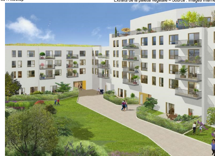
La résidence vue de l’extérieur et depuis l’intérieur - Source : Terralia et Gambetta – DVA/DVD