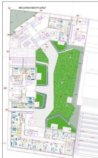
Plan masse des plantations

Les essences proposées nécessitent peu d’entretien et supportent l’ombrage.