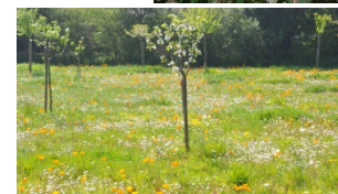
Extraits de la palette végétale