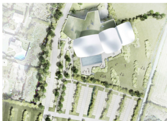
Plan masse et rez-de-chaussée inséré