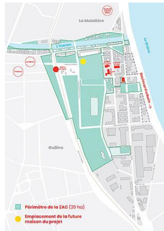
Périmètre et plan de localisation de la ZAC et des îlots PUP