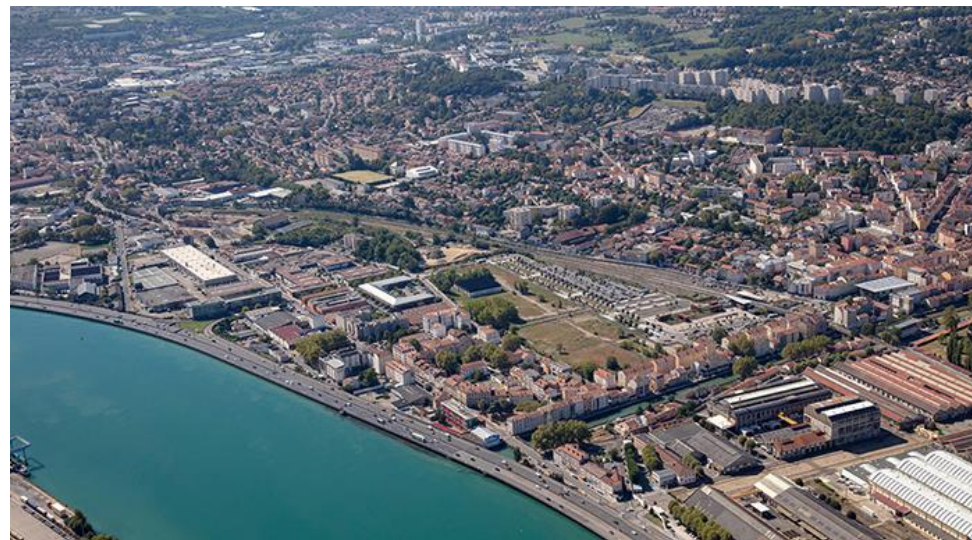
Vue aérienne de la ZAC de la Saulaie