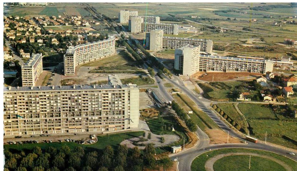
Carte postale ancienne de la ZAC Bron-Parilly