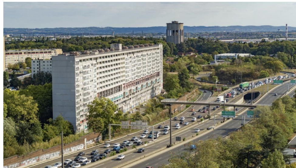
Vue aérienne de la ZAC Bron Parilly