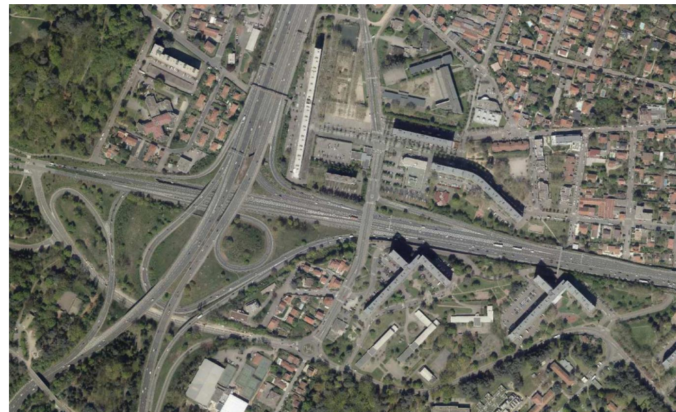
Vue aérienne de la ZAC Bron Parilly

Le programme de construction s'appuiera sur une trame d'espaces publics créés ou à restructurer d'environ 11,2 ha.